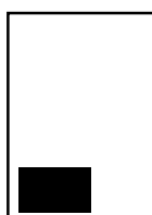
1/8 page hauteur L 103 x H 70