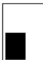
1/4 page hauteur L 103 x H 130