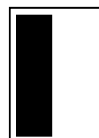
1/3 page hauteur L 70 x H 280