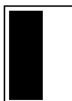
1/2 page hauteur L 103 x H 280